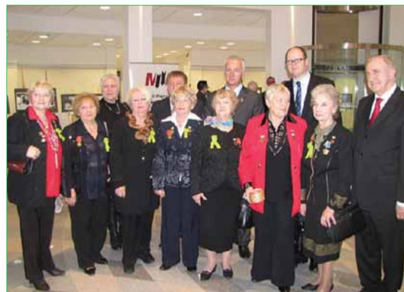
Участники делегации в г. Гданьске

P.S.: Польскому музею Второй мировой войны для создания экспозиции, отражающей жизнь осажденного Ленинграда, не хватает предметов быта ленинградцев, особенно нужны музею блокадные санкции. Обращаться по тел.: 297-57-16.