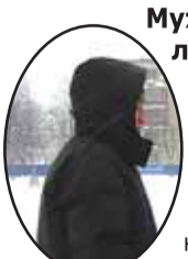
Мужчина, средних лет, двор дома по Пискаревскому проспекту:

Я вот каждый день иду мимо дома, и на балкон соседский смотрю с опаской: а его кто должен чистить от снега – тоже Матвиенко? А ведь там такие завалы снега, что еще чуть-чуть – и он рухнет... Страшно представить, что под ним окажутся люди, дети.